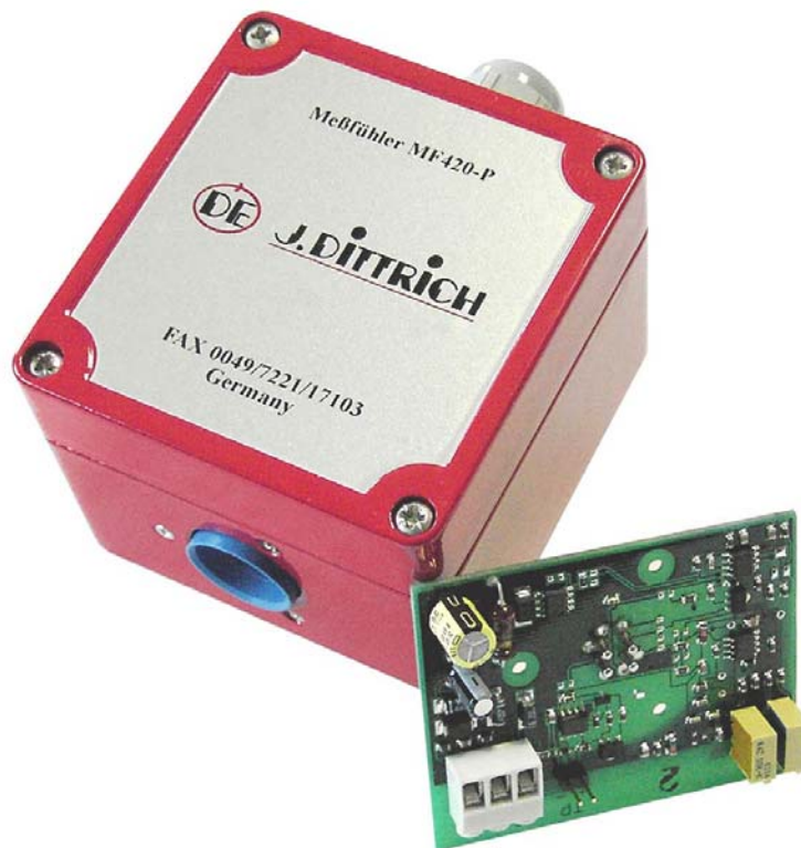
Abb. 1: Gasmesssystem MF420-P.

Der Pellistor ist auf einem Sensorhalter in einem Aluminiumgehäuse über einer Diffusionsöffnung montiert. Die Kabeleinführung erfolgt gegenüber mittels einer Kabelverschraubung (PG11). Das Aluminiumgehäuse enthält zudem den Transmitter mit einem Signalverstärker und einem analogen Ausgang mit 4-20 mA. Der Transmitter bereitet die Meßsignale auf und überträgt sie (siehe Abb. 1). Er funktioniert nach dem Drei-Draht-System.